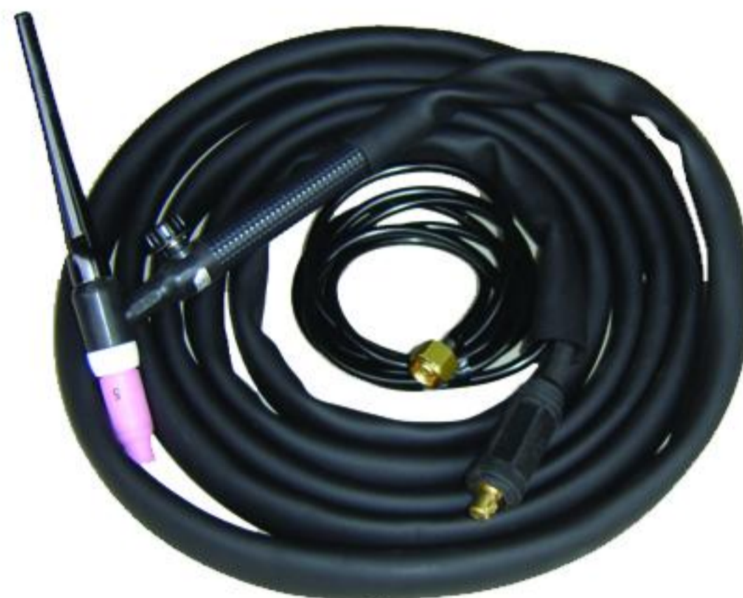
TIG SR 17 V 4M