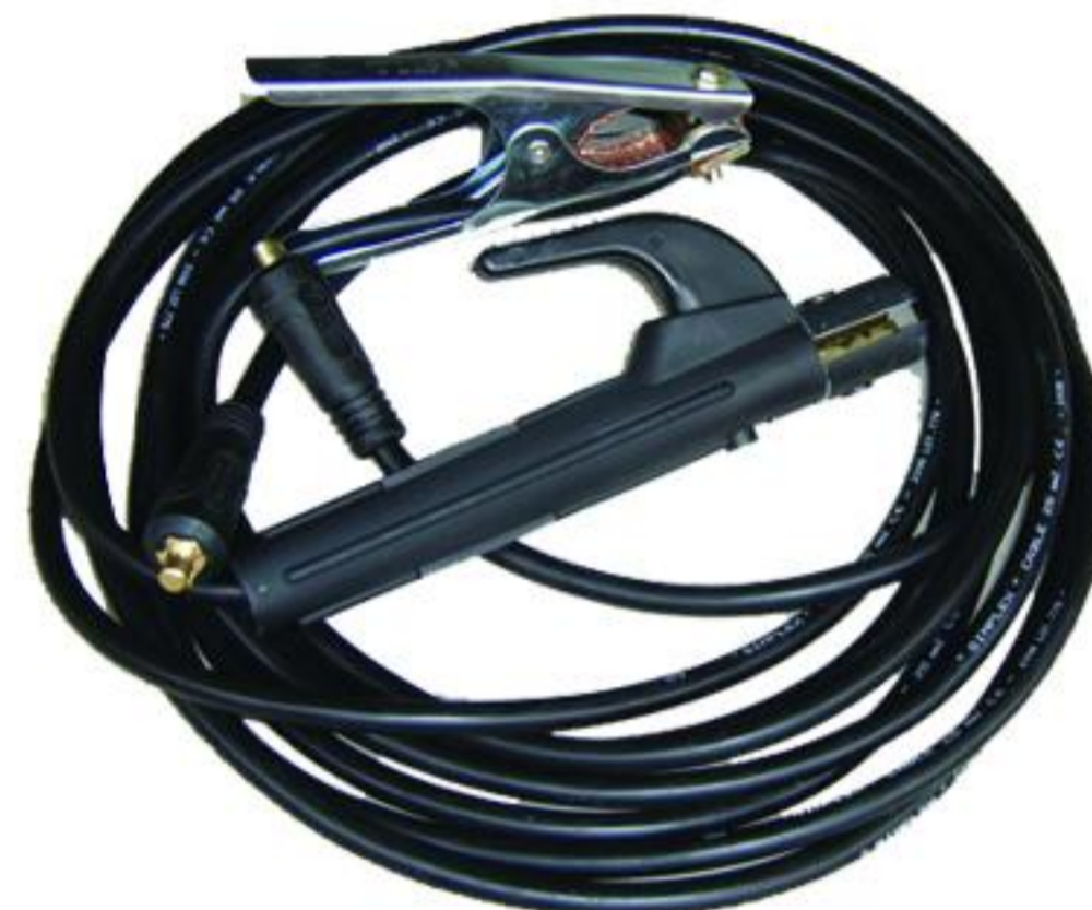
SET 16MM - 25MM 5 + 3 METPA