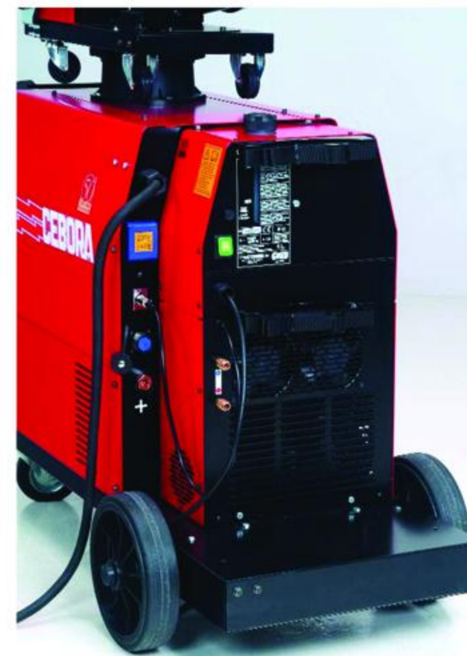
Art 1680 Ψυγείο για υδρόψυκτη τσιμπίδα