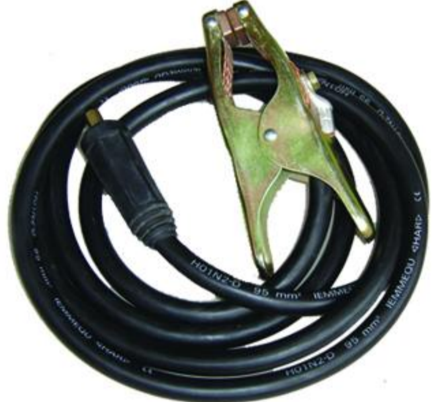
Καλώδιο γείωσης 95 mm