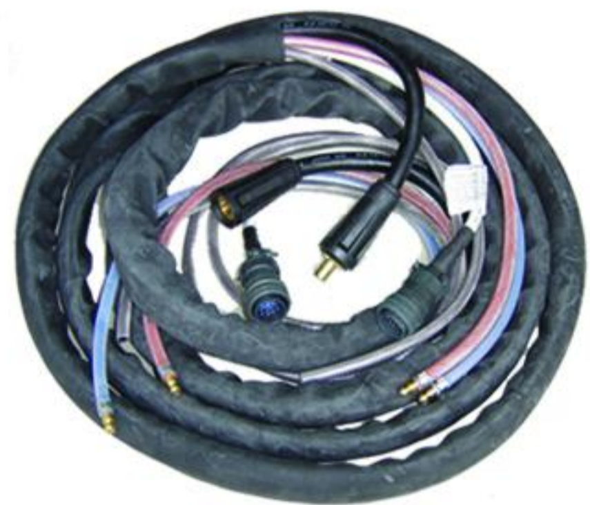
Προέκταση καλωδίων 5 ή 10 μέτρα